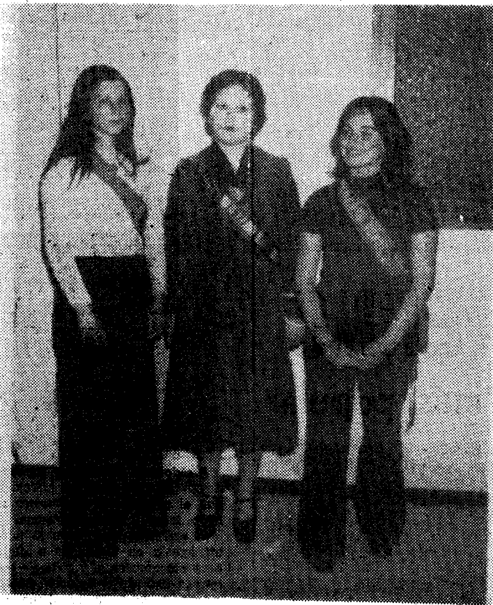
«LA CAMPESINA DEL AÑO Y SUS DAMAS DE HONOR»

que siguieron a la campesina de honor y como ya decimos con sobrados méritos para ser primeras campesinas cada una de las dos. Jacinto Suárez Martell